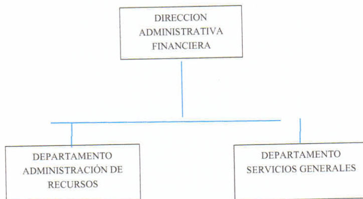
FIGURA 2: ORGANIGRAMA DIRECCIÓN ADMINISTRATIVA FINANCIERA

Dentro de las acciones de coordinación realizadas menciono las de más relevancia: la verificación del cumplimiento de los objetivos de las áreas que conforman el departamento, supervisar y controlar las funciones del personal de las diferentes áreas del Depto. de Administración de Recursos. Estos objetivos son la administración de recursos financieros, la ejecución del presupuesto aprobado, los informes y estados financieros contables, el control y evaluación los procesos relacionados con la administración del sistema de talento humano, así como lo relacionado con el reclutamiento, selección de personal, relaciones laborales, salud ocupacional, capacitación, entre otros.